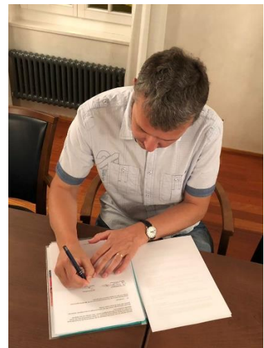
Der Präsident und der Protokollführer unterzeichnen die Statuten